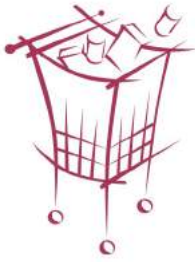
Magasin - Partage Anjou

Vous êtes un·e fidèle lecteur/lectrice du Concert'Express et vous vous demandez comment vous pourriez aider à la préparation du prochain Magasin-Partage de la rentrée scolaire qui aura lieu le 16 août prochain? Nous avons la solution pour vous: joignez-vous au dynamique comité organisateur de ce Magasin-Partage! Nos premières rencontres d'organisation auront lieu à la fin avril: donnez votre nom et nous vous contacterons. Vous allez voir que cela fait du bien de faire du bien.