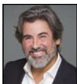
Pablo Rodriguez Député fédéral d'Honoré-Mercier pablo.rodriquez@parl.gc.ca